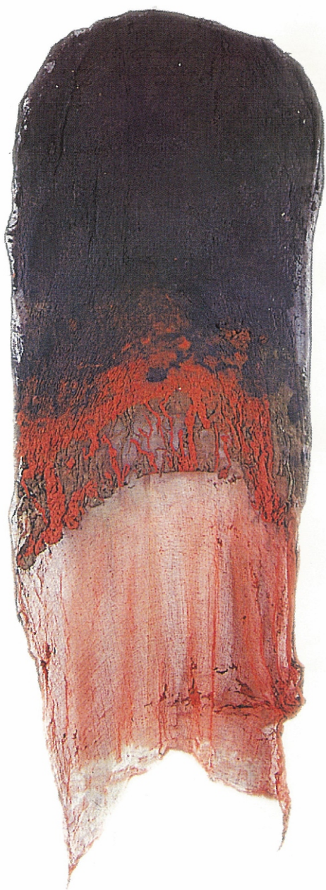
64" X 22" - Untitled, 2002 Paper Pulp, Colour Dyes & Gauze