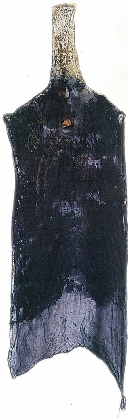
68" X 20" - Untitled, 2002 Paper Pulp, Colour Dyes & Gauze