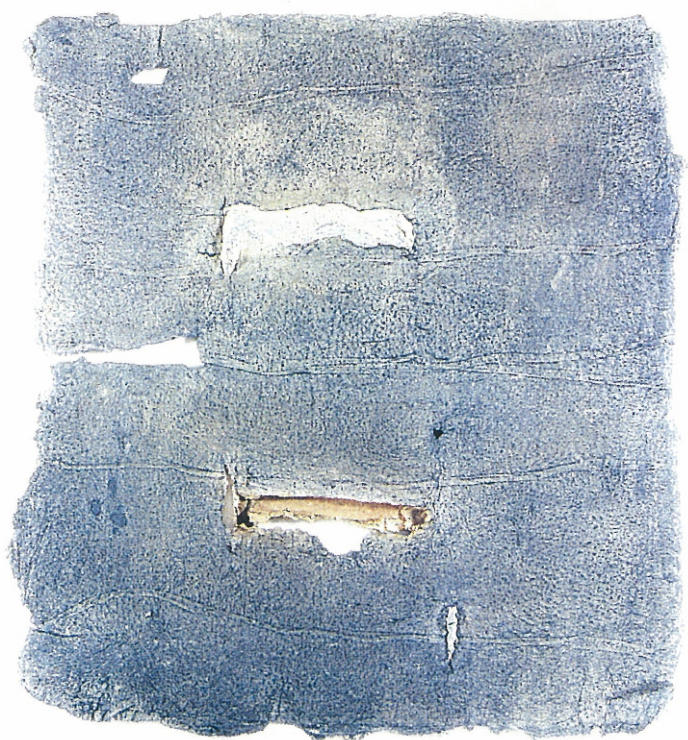
36" X 33" - Untitled, 2000 Paper Pulp, Colour Dyes & Gauze