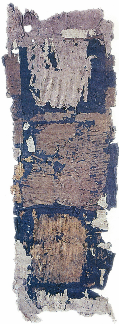
66" X 24" - Untitled, 2002 Paper Pulp, Colour Dyes & Gauze