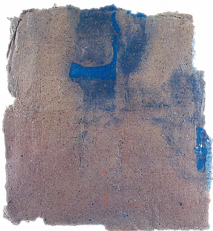
26" X 24" - Untitled, 2001 Paper Pulp, Colour Dyes & Gauze