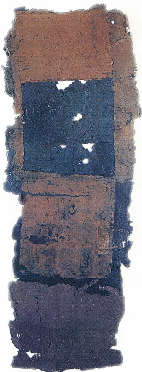
66" X 25" - Untitled, 2002 Paper Pulp, Colour Dyes & Gauze