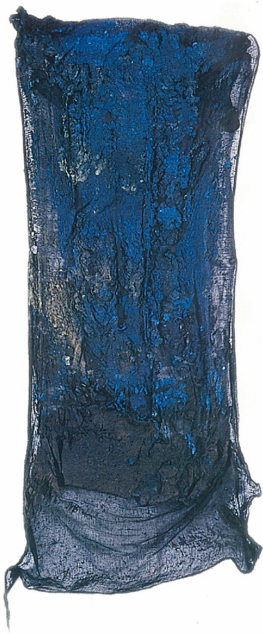
53" X 24" - Untitled, 2002 Paper Pulp, Colour Dyes & Gauze